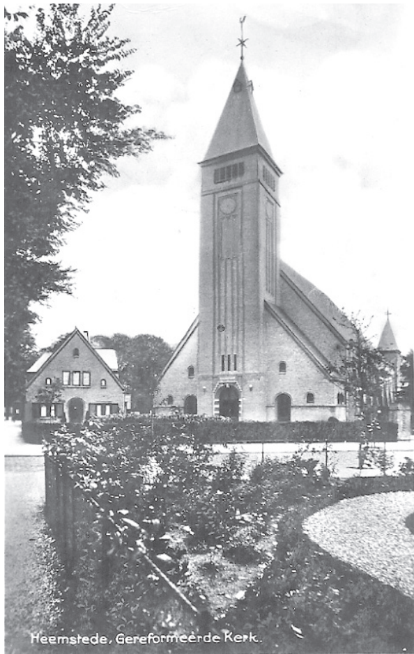
Heemstede, Gereformeerde Kerk.

De Gereformeerde Kerk in Heemstede kreeg in 1921 dit grote kerkgebouw aan de Koediefsaan. De Opstandingskerk was echter niet tijdsbestendig en werd in 1990 gesloten. Afbraak volgde in 1992.