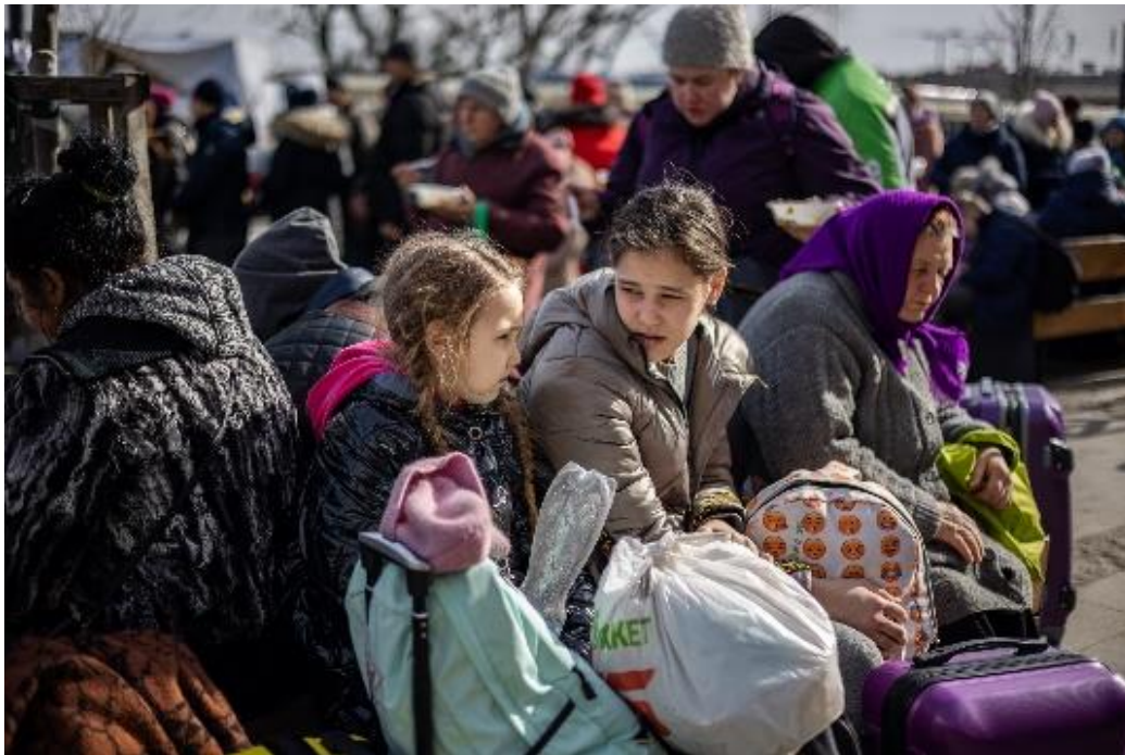
Vluchtelingen in Lviv.

Het Oekraïens Bijbelgenootschap is een verbindende schakel tussen de verschillende kerken, vrijwilligersgroepen en hulporganisaties. In het begin van de oorlog telde één ding, aldus het OBG: 'Je zorgt voor je gezin en probeert dat in veiligheid te brengen. Daarna kwam iedereen in actie. Ik bewonder de moed van mijn collega's die in het oosten en zuiden van Oekraïne werken.' De behoefte aan opvang en troost, maar ook aan hoop en perspectief uit de Bijbel is enorm. Dat zal zo blijven ook nadat de oorlog voorbij is. Want: 'Dan moeten mensen verwerken wat er allemaal gebeurd is`.