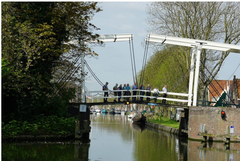
In Edam

Het was een mooie warme dag en een heel mooie wandeling.