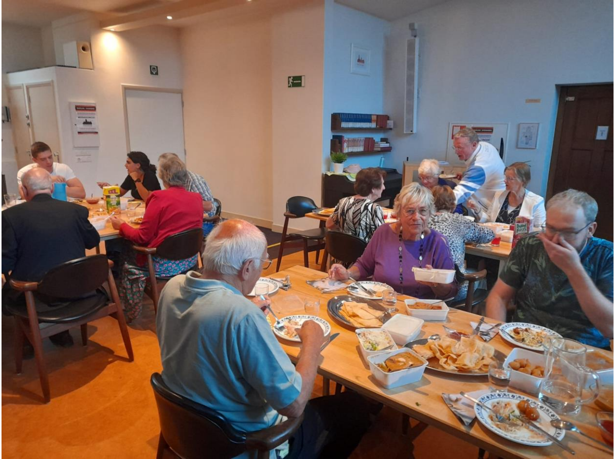
Met vriendelijke groet,