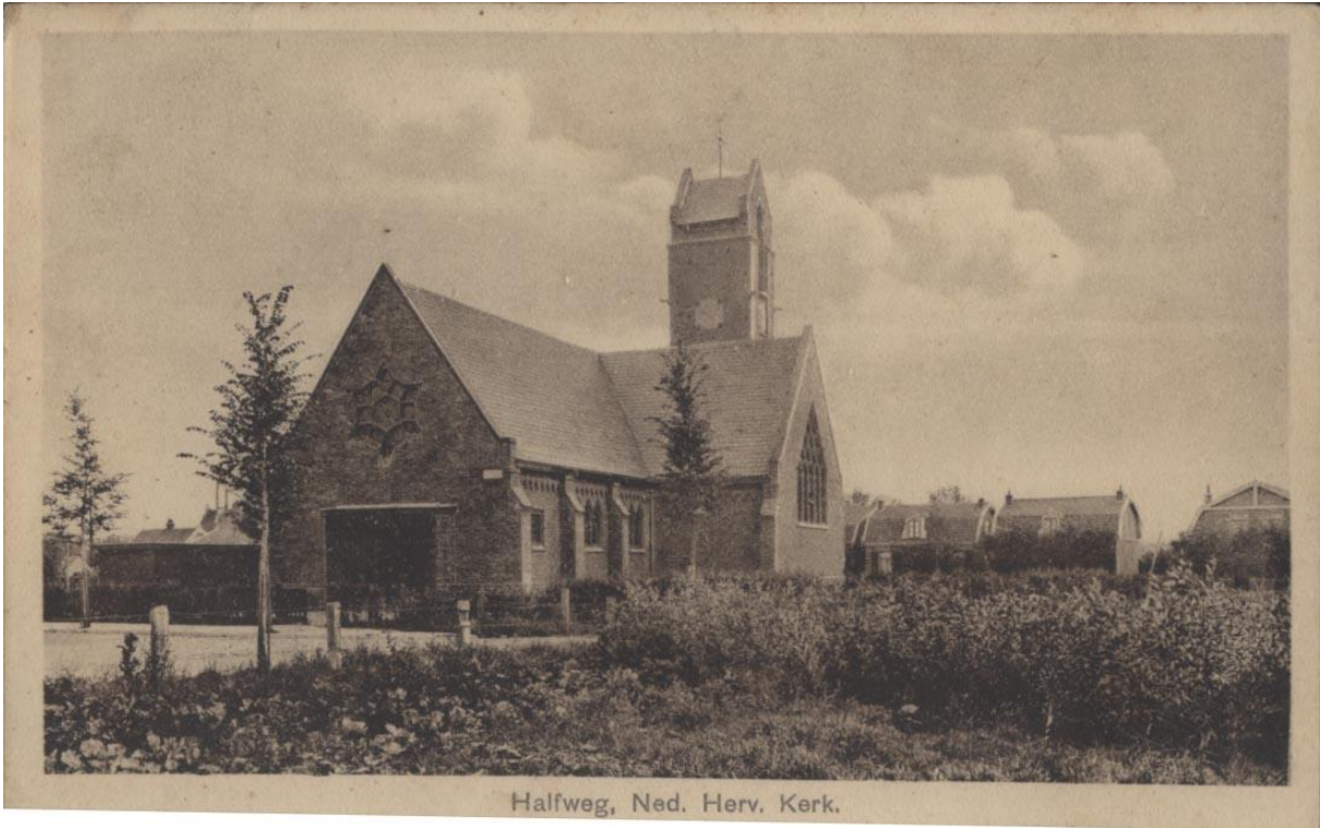
Halfweg, Ned. Herv. Kerk.