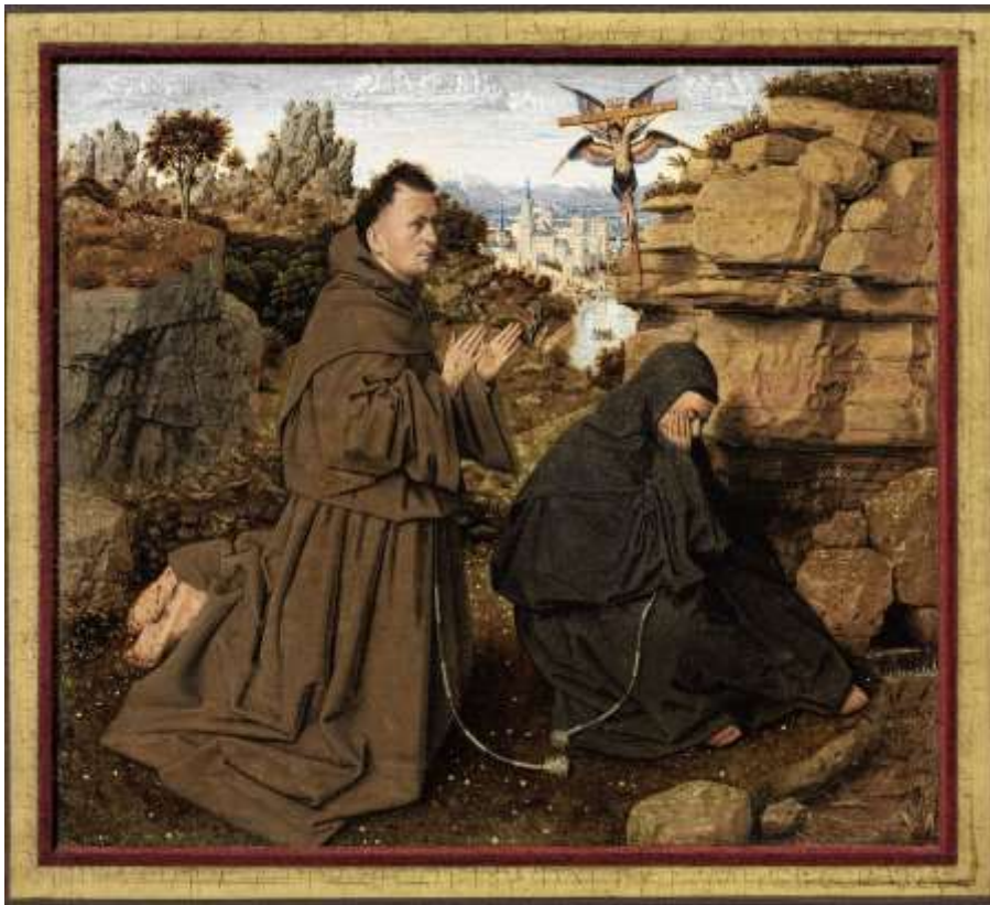
Jan van Eyck, Heilige Franciscus ontvangt de stigmata , ca. 1430-1432.